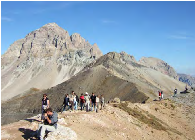
Géologie de l'ingénieur et formation : étudiants et enseignants en excursion géologique au Col du Galibier. Nappes de charriage (Savoie et Hautes-Alpes).

Ensuite, utilisant ces systèmes de surveillance, de nouvelles décisions d'ingénierie peuvent être prises, si nécessaire, prenant appui sur une méthode d'observation, parfois nommée méthode observationnelle, où les comportements du massif de sol, du massif rocheux et des ouvrages d'ingénierie sont continuellement vérifiés. Les décisions doivent être rapides, fonction de scénarios de comportement préalablement considérés, éventuellement simulés numériquement.