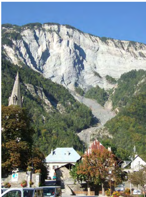
Géologie de l'ingénieur et risques naturels : Le Bourg-d'Oisans (Isère) au pied de la falaise liasique du Prégentil. Torrent du Saint-Antoine et laves torrentielles.

aux intensités amplifiées et périodes de retour plus courtes, avec des conséquences désastreuses pour nos aménagements. Les techniques de prévision et de limitation des effets de ces phénomènes d'origine climatique devront continuer de se développer dans le futur et la géologie de l'ingénieur devra être au premier rang pour contribuer à ces tâches.