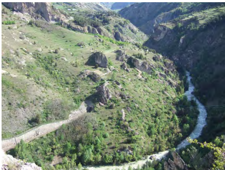
Géologie de l'ingénieur et ouvrages : le tunnel de l'Encombrouze traversant un versant instable au cœur de la fenêtre géologique de l'Argentière (Hautes-Alpes).

L'organisation, l'historique et les actions du CFGI sont présentés dans le deuxième chapitre de cette première partie de l'ouvrage.